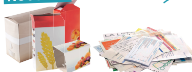
Tous les papiers et les petits cartons se trient et se recyclent