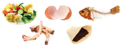
Épluchures, restes de repas, coquilles, marc de café, essuie tout, croustes de fromage, restes de viandes, de poissons et de crustacés...