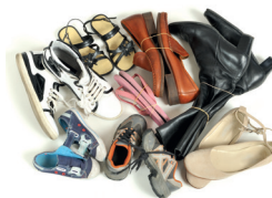
Tous les vêtements et le linge se déposent propres et secs, même s'ils sont usés. Les chaussures s'attachent par paire.