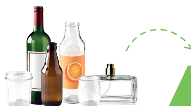
Bocaux, pots en verre, bouteilles en verre