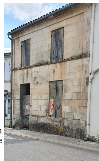
Réhabilitation du 6, rue de l'ancienne gare