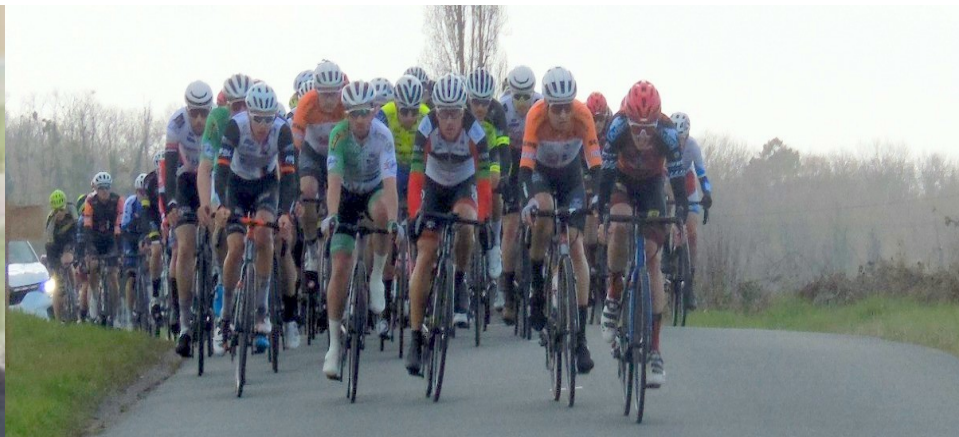
Traversée de notre village par cette course cycliste légendaire le BORDEAUX SAINTES le 13 mars dernier .

En raison des mesures sanitaires que tout le monde a subi, la municipalité n'a pu organiser les vœux de monsieur le maire en présentiel. Il s'est donc adressé à ses administrés, anciens et nouveaux par le biais d'une vidéo publiée sur la page Facebook « Mairie de Saint André de Lidon » le 24 janvier . Nous espérons que vous avez pu la regarder !