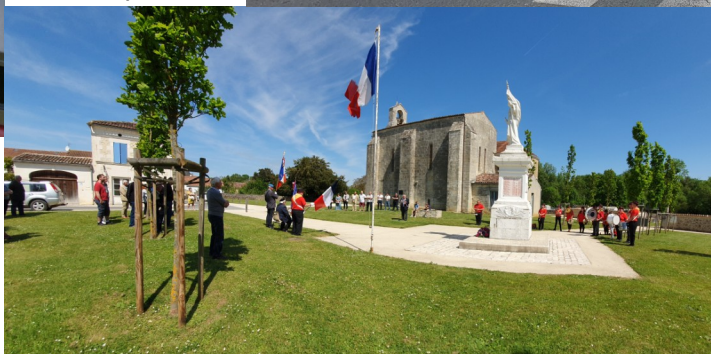
Cérémonie de commémoration de la fin de la seconde guerre mondiale le dimanche 8 mai à 12h devant le Monument aux Morts