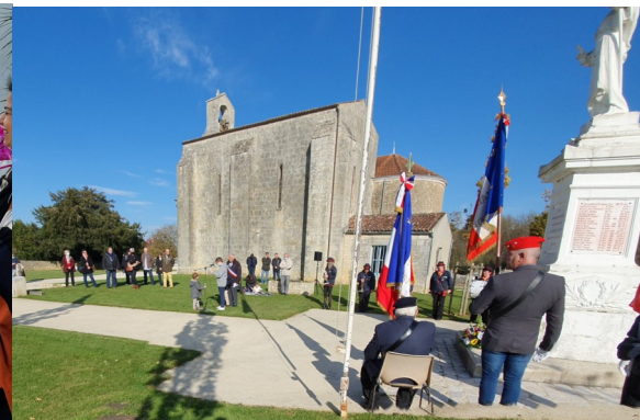
Cérémonie commémorative de l'Armistice du 11 novembre 1918