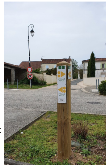
Balisage des sentiers de Trotte-Chien

2-4 La signalétique des sentiers de randonnée (circuit de 12.4km) sera posée début 2022 sous la direction du comité départemental de cyclo tourisme de Charente-Maritime.