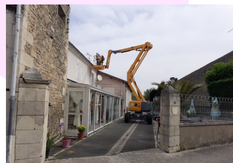
Démoussage des toits par l'ent. Maucourt