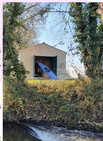
La halte fluviale