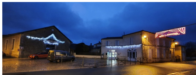
Les branchements des illuminations seront mis en conformité