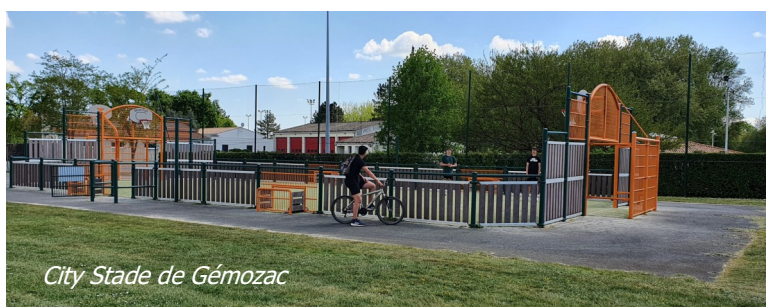
City Stade de Gémozac

Ce contrat de ruralité a été signé entre l'Etat, la Saintonge Romane et trois EPCI (CDC Gémozac, CDA Saintes, CDC Cœur de Saintonge)