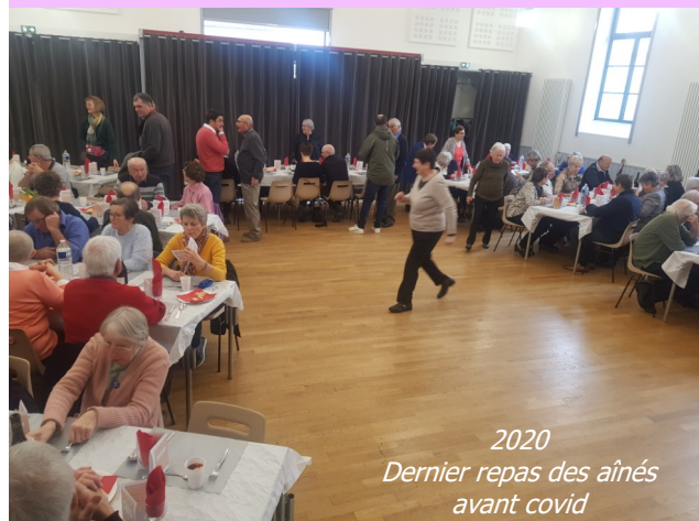
2020 Dernier repas des aînés avant covid