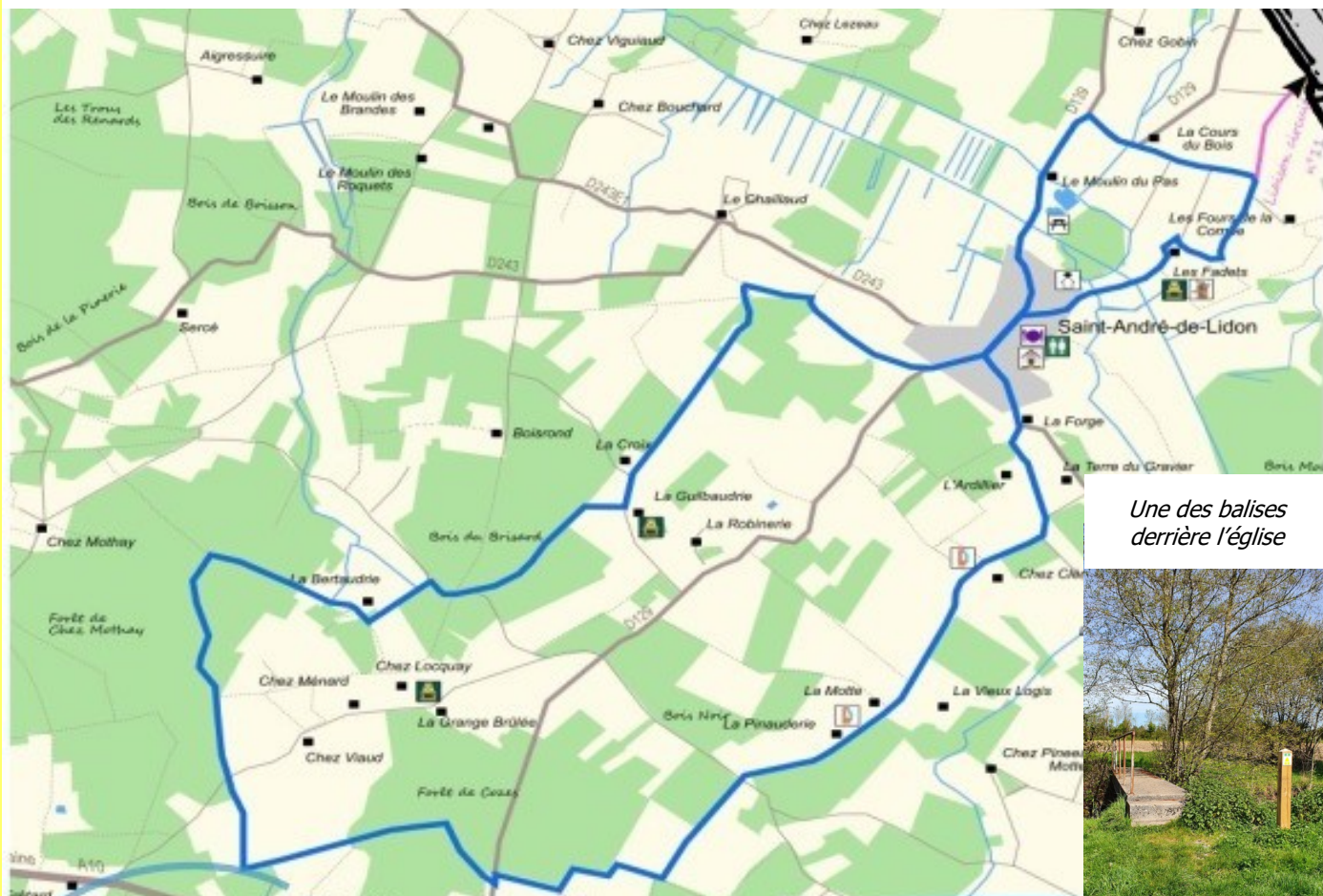
Une des balises derrière l'église

Au départ place du Champ de Foire, un planimètre d'information sera implanté près de l'abribus.