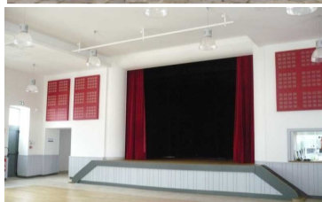
Scène et piste de danse