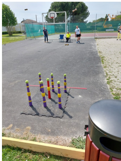
1ère journée du tournoi de Quilles de 7 dimanche 1 er mai au stade municipal sur le terrain de pétanque.

2ème course cycliste à traverser le bourg et les villages de la commune : les Boucles de Charente Maritime le samedi 7 mai vers 15h Une prime a été attribuée au 1 er en tête sur cette photo