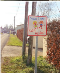
La cour du bois