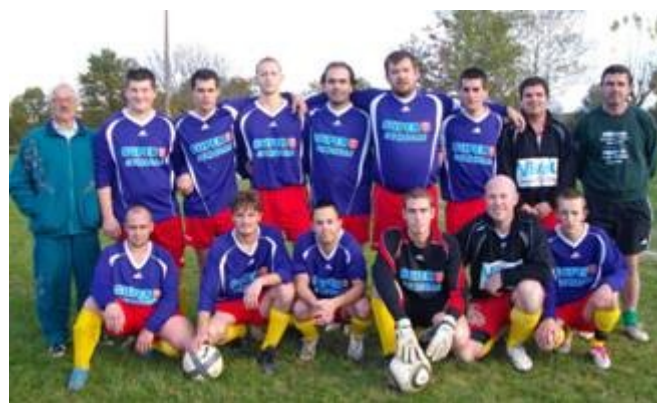
La rubrique rétro...et ses anciennes gloires!