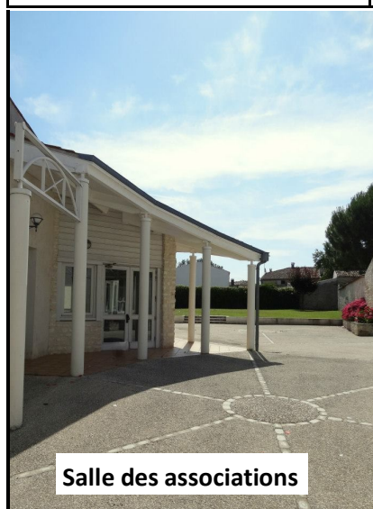
Salle des associations