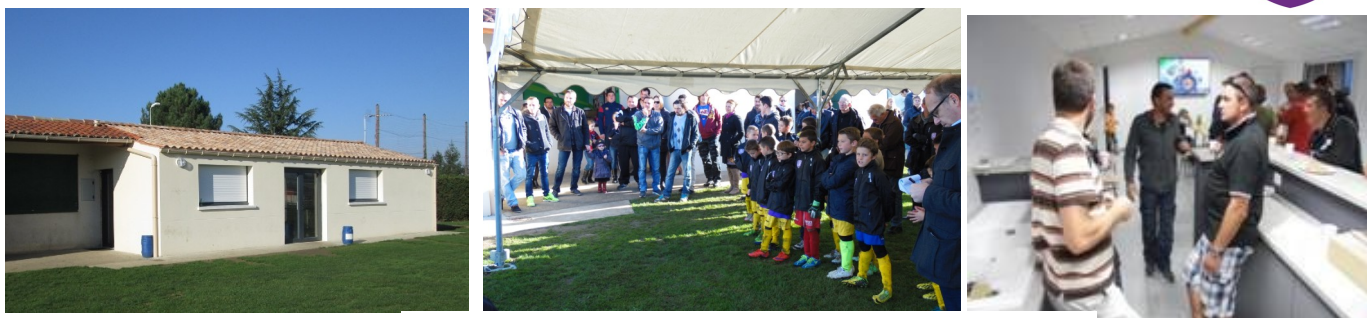
Inauguration du Club House

La vie du club, c'est aussi la participation à la vie communale. Plusieurs concours de belote ont été organisés avec un succès toujours grandissant. Bien que les locaux y aient été peu nombreux, l'USL renouvellera ces concours (belote, pétanque) pour que ces actions s'inscrivent dans le temps et emportent l'adhésion de tous.