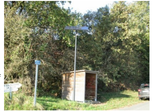
Eclairage solaire de l'abri bus Chemin de La Guilbauderie

-L'éclairage public sur notre commune concernent 115 points lumineux regroupés en 42 compteurs équipés d'horloges astronomiques. -L'addition de ce dispositif et l'ajustement des plages horaires d'allumage et d'extinction ont permis une économie de 15% à 30% suivant la période.