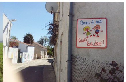
Rue des Ecoles