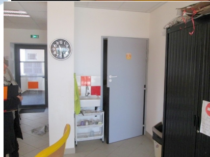
Accessibilité des lieux aux handicapés - WC aux normes « handicapés »