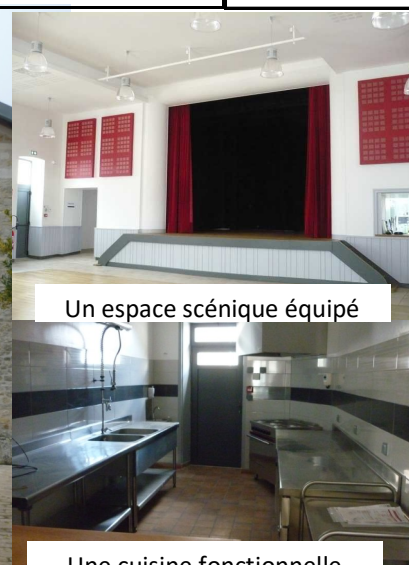
Un espace scénique équipé Une cuisine fonctionnelle