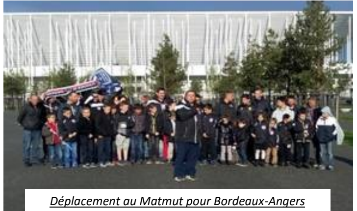
Déplacement au Matmut pour Bordeaux-Angers