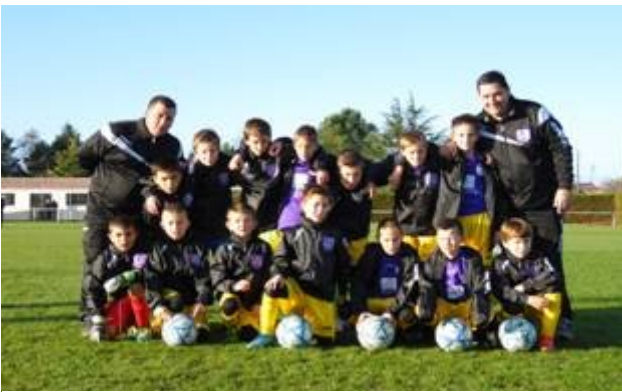
Création d'une équipe U11

La saison 2015-2016 aura été, sans conteste, celle de l'école de football et de l'équipe « vétérans ».