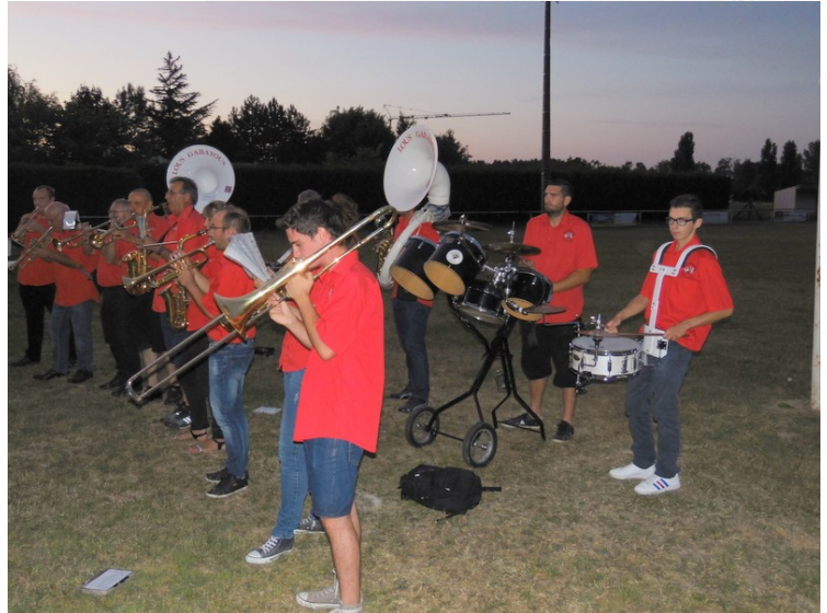
« Lous Gabayous » (banda) lors du repas champêtre du 13 juillet suivi d'un feu d'artifice