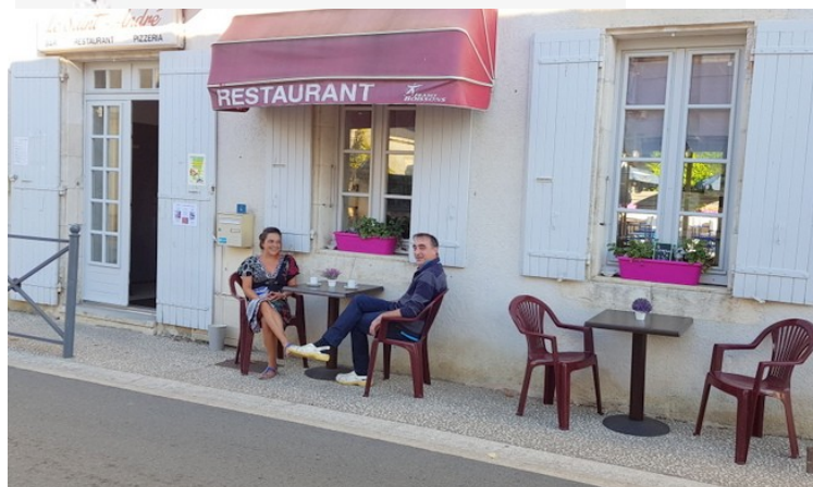
Réouverture du Bar Restaurant Pizzeria LE SAINT ANDRE le 25 mai 2018