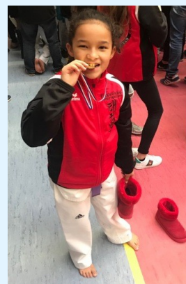
Notre jeune concitoyenne - tout juste 10 ans - affiche déjà une belle collection de médailles dans sa discipline, le TAEKWONDO :