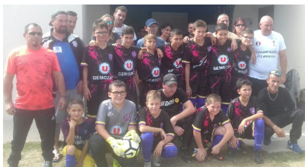
L'équipe U15 2018/2019