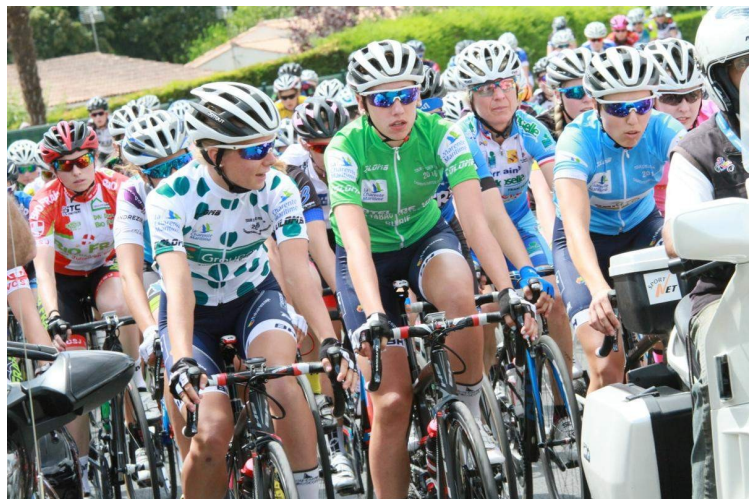
Traversée du village par le 19ème tour Cycliste féminin le 5 août 2018