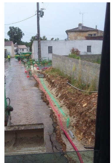
Tranchée rue de la cour du bois

Démarrage des travaux seconde quinzaine de mai