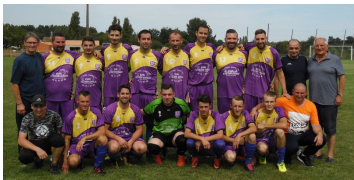
Une partie de l'équipe Séniors

Les week-ends sans match sur le terrain lidonnais ne seront pas nombreux.....venez les soutenir.