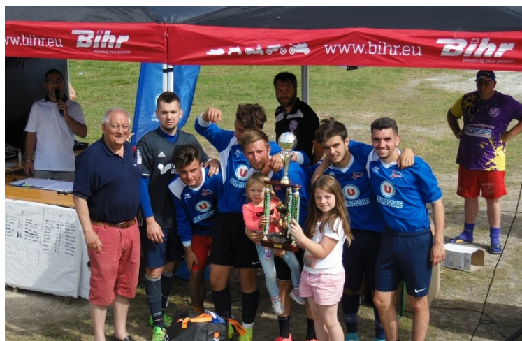
Remise de la coupe aux vainqueurs du Tournoi de Sixte le 24 juin 2018