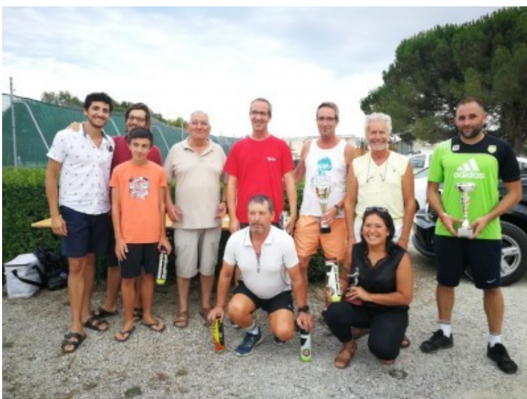
Tournoi de tennis des 10, 11 & 12 août 2018