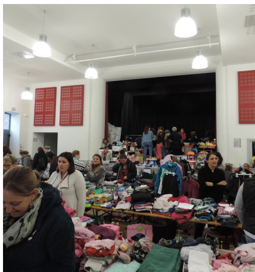
Bourse à l'enfance et Vide dressing Dimanche 7 octobre 2018