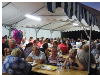
Grosse affluence au repas du 13 juillet

Le succès a été au rendez vous avec près de 250 repas servis, une animation de qualité (Bandas) et un public satisfait. Un grand merci aux aidants bénévoles, aux sponsors, aux employés communaux et à la municipalité pour leur soutien et leur implication.