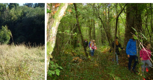
« Rando » des marrons dimanche 7 octobre 2018