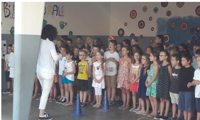
Fête de l'Ecole le 30 juin 2018