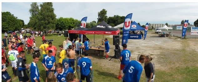
Tournoi de Sixte

Sur le bilan financier, le solde est excédentaire, dopé par le succès du loto du mois de janvier et le tournoi de sixte de juin.