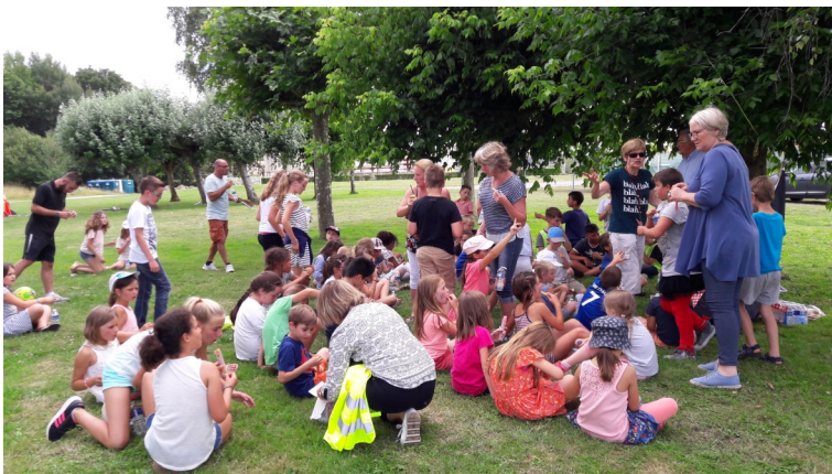
Goûter des ateliers périscolaires le 6 juillet 2018