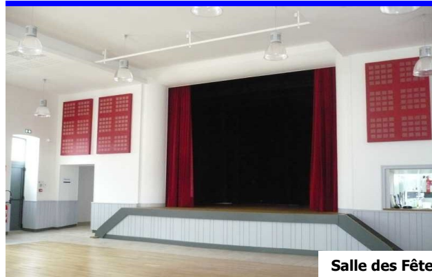
Salle des Fêtes