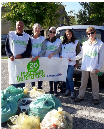
Opération « Nettoyons la nature » Samedi 29 septembre 2018