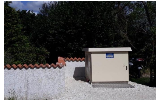
Poste électrique route de Saintes