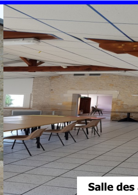
Salle des associations