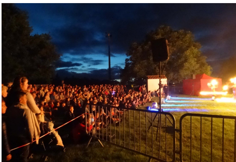
Fête de l'Eté le 16 juin 2018