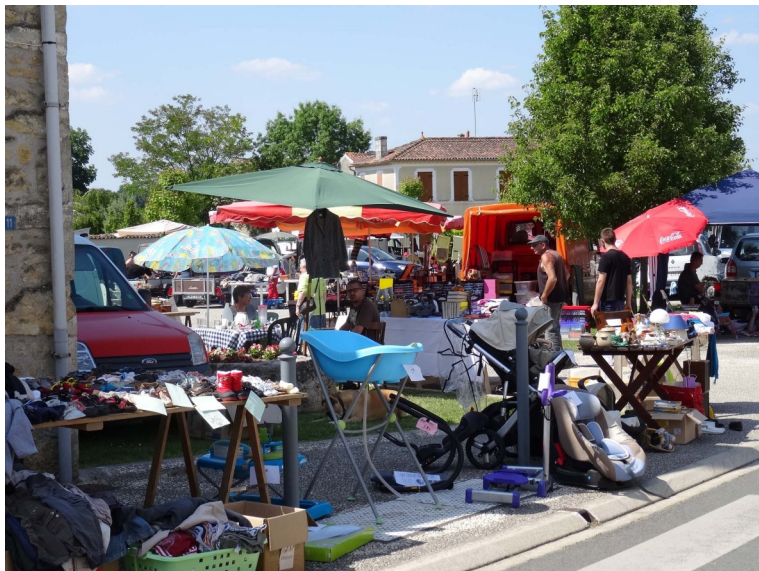
Brocante du dimanche 20 mai 2018