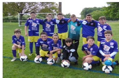
L'équipe U13 2017/2018