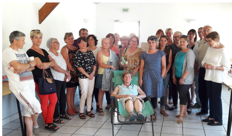
Pot des animateurs des ateliers périscolaires Le 22 juin 2018